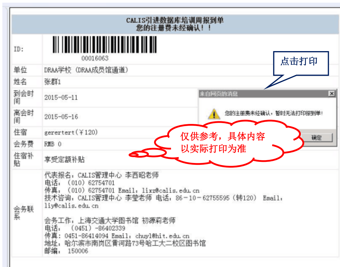
(CALIS 引进数据库培训周报到单样例)

确认报名信息不会变更后，请登陆“参会代表报名”打印“CALIS 引进数据库培训周报到单”（一人一份，非补贴名额需缴费后才能打印）， 切记：修改注册信息后请重新打印注册单。报到时请携带报到单办理注册手续。