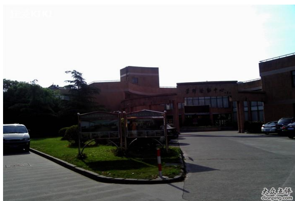
学术活动中心外观

上海交通大学闵行校区学术活动中心： 坐落于闵行东川路交通大学内，其馆名由江泽民主席亲笔书写。学术活动中心依托百年老校其文化氛围浓厚，宾馆内有苏式园林花园，环境幽雅。距离陈瑞球楼学术报告厅会场约15分钟路程（步行至会场，不安排车辆接送）。