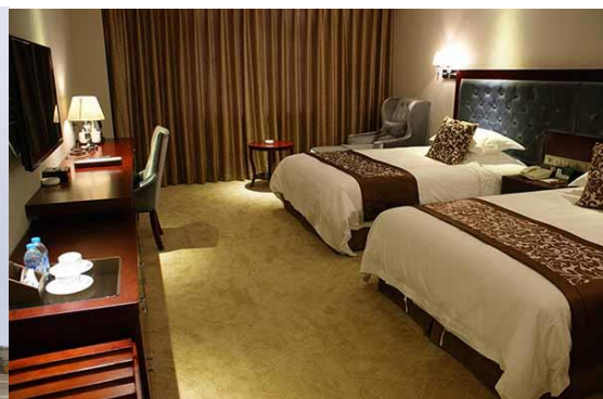
海舟大酒店标准双人间