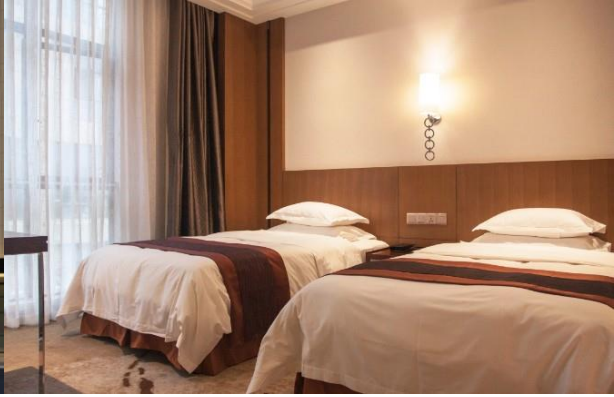
曼哈顿酒店标准双人间