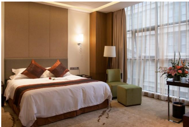
曼哈顿酒店标准单人间